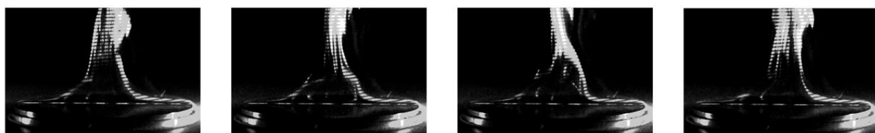
Рисунок 1. Визуализация нестационарного режима течения

Описывается модель возникновения второго устойчивого режима течения, для которого характерно периодическое разрушение пристенного слоя и формирование крупномасштабных вихревых нагретых структур (рисунок 1).